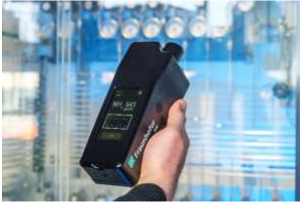
Abb. 3 Wasserstoff kann in Form von Ammoniak (NH 3 ) gespeichert und transportiert werden. Das Laserspektrometer des Fraunhofer IPM absorbiert die Wellenlänge von Ammoniak, reagiert deshalb sofort und zeigt das Ergebnis auf einem Display an.