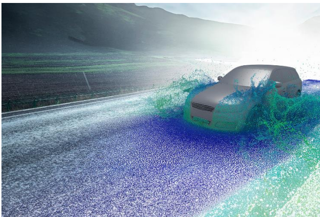
Abb. 2 Die verwendete numerische Punktwolke ist dazu in der Lage, sich flexibel an bewegliche Geometrien anzupassen. So können komplexe Abläufe wie z. B. Wasserdurchfahrten zeitsparend simuliert werden.

----- FORSCHUNG KOMPAKT 12. Juni 2024 || Seite 3 | 3 -----